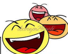
Cười toé miệng cười rống

-Yeah!... Please sympathize with me because that team's Goalkeeper is my future brother- in- law.